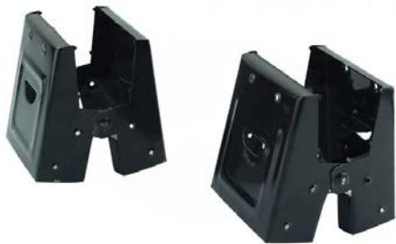
КРОНШТЕЙН (НІЖКИ, ЯКІ МОЖНА СКЛАСТИ)