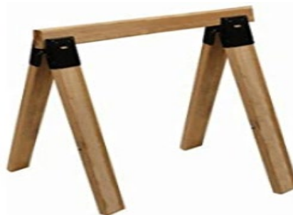
КОРОТКІ ОПОРНІ НІЖКИ